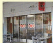
2 食亭 十字や

メインスタンド3階にあります。定食や一品料理まで幅広く揃っています。豚汁や味のよく染みたおでんもオススメです。