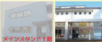
5 メインスタンド1階 総合案内所横に移動いたしました。

サブスタンド1階にあり、焼き鳥やたこ焼きが楽しめます。居酒屋風のメニューも多く、いろいろな味が楽しめます。