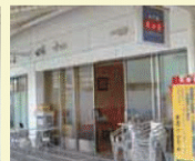
3 味百錢 成田屋

サブスタンド1階にあります。店内には大きな鉄板があり、目の前で焼きそばをつくってくれます。丼や麺類などメニューも充実しています。