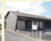
7 ふれあいルーム (幼児休憩所)

小さなお子さんと女性の保護者にご利用いただけるお部屋です。絵本や遊具が用意してある、くつろぎのスペースです。男性のご入室はご遠慮ください。