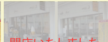
4 閉店いたしました。

サブスタンド1階にあります。ボリュームのある定食をはじめ、バラエティ豊かなメニューが楽しめます。夏には冷麺もオススメです。