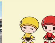
8 競輪温泉・市民広場

小さなお子さんと女性の保護者にご利用いただけるお部屋です。絵本や遊具が用意してある、くつろぎのスペースです。男性のご入室はご遠慮ください。